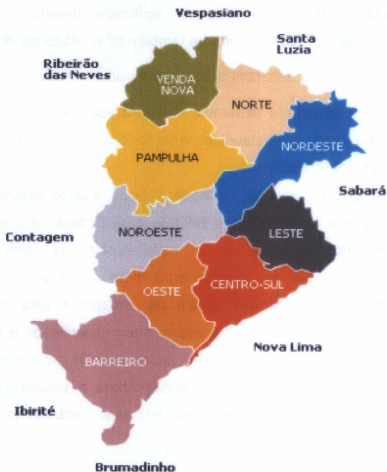
Distritos Sanitários do município de Belo Horizonte

O Centro de Saúde Independência está localizado no município de Belo Horizonte, na regional Barreiro. Segundo informações do Censo de 2010, do IBGE, a Regional Barreiro apresenta a população de 282.582 indivíduos. Essa regional é um dos distritos sanitários do município. Sabe-se que Belo Horizonte conta com nove distritos sanitários, os quais estão especificados no mapa a seguir: