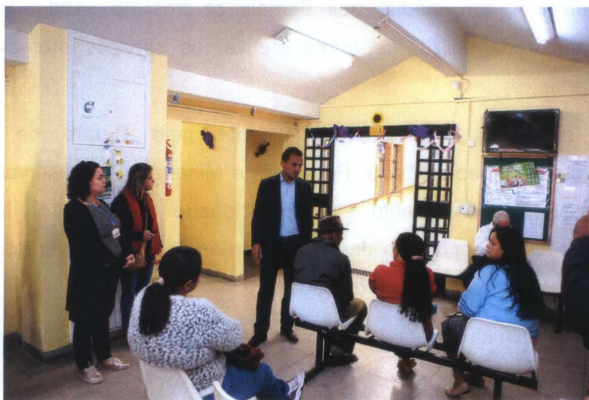
Sala de espera para acolhimento dos usuários.