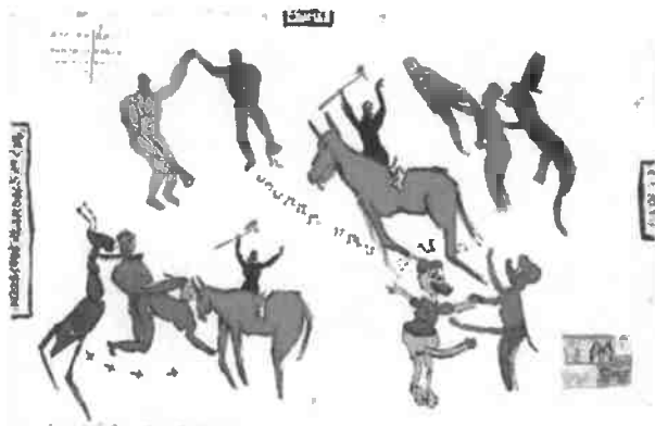
Mostra e a Pista que o PNBH (180 x 130 cm), EDUALTE DIVERTIDO SOBRE PLACAS DE ALARMO