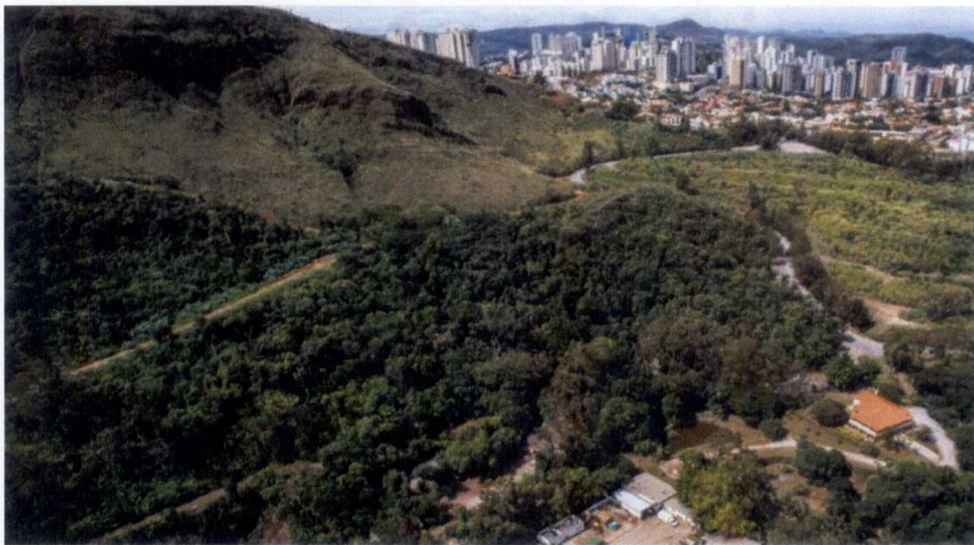
Vista geral da mineração e da Vila Acaba Mundo