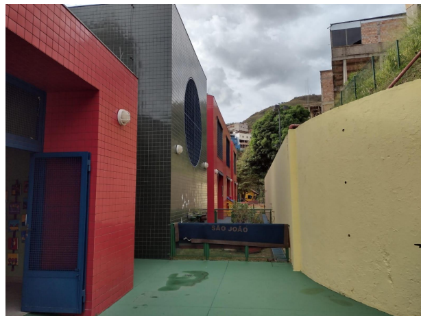
Espaços da EMEI São João - Regional Centro-Sul (Fotos por: arquivo pessoal de Wellington Dias).