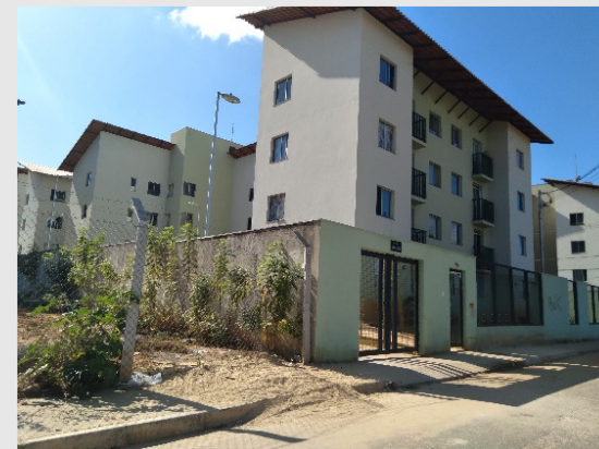
Conclusão do Vila Viva São Tomás/ Aeroporto