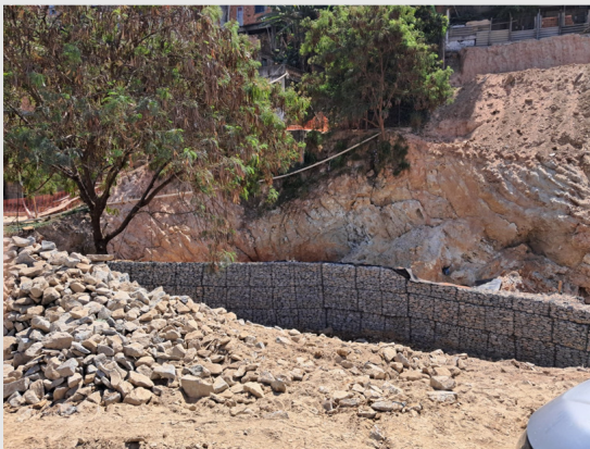
Encosta no Conjunto Jardim Felicidade