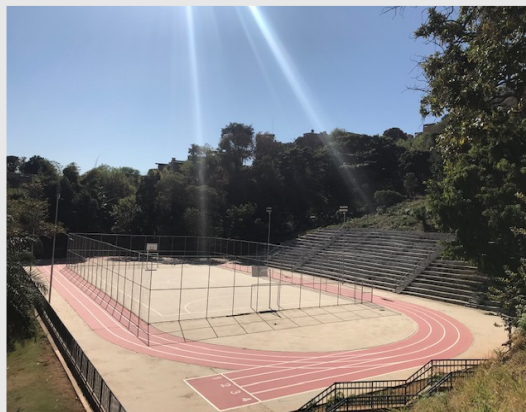
Conclusão do Vila Viva Aglomerado Morro das Pedras