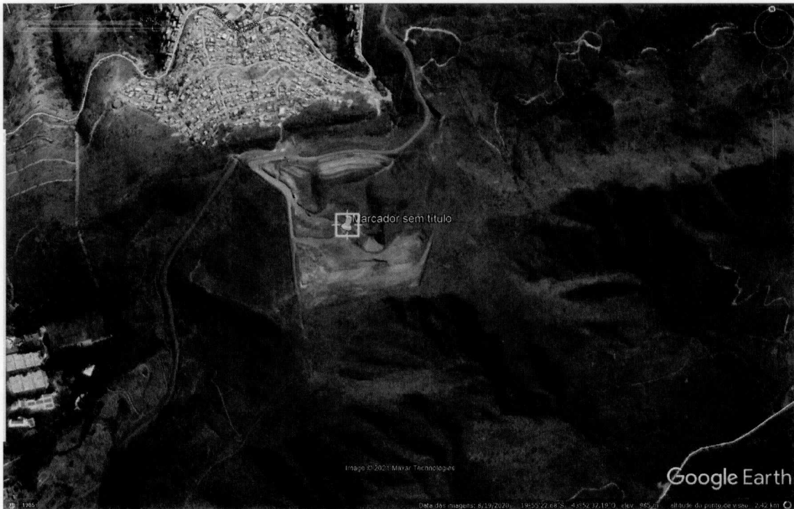
Figura 3 - Imagem de satélite do dia 19/08/2020