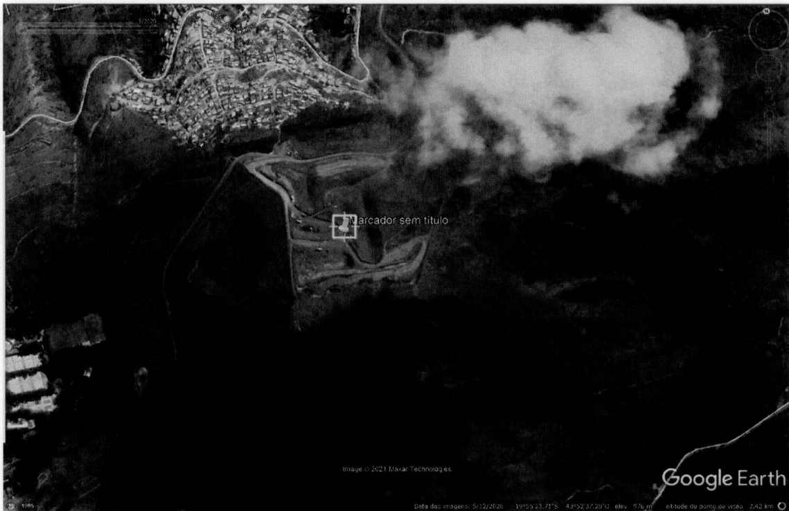
Figura 2 - Imagem de satélite do dia 12/05/2020