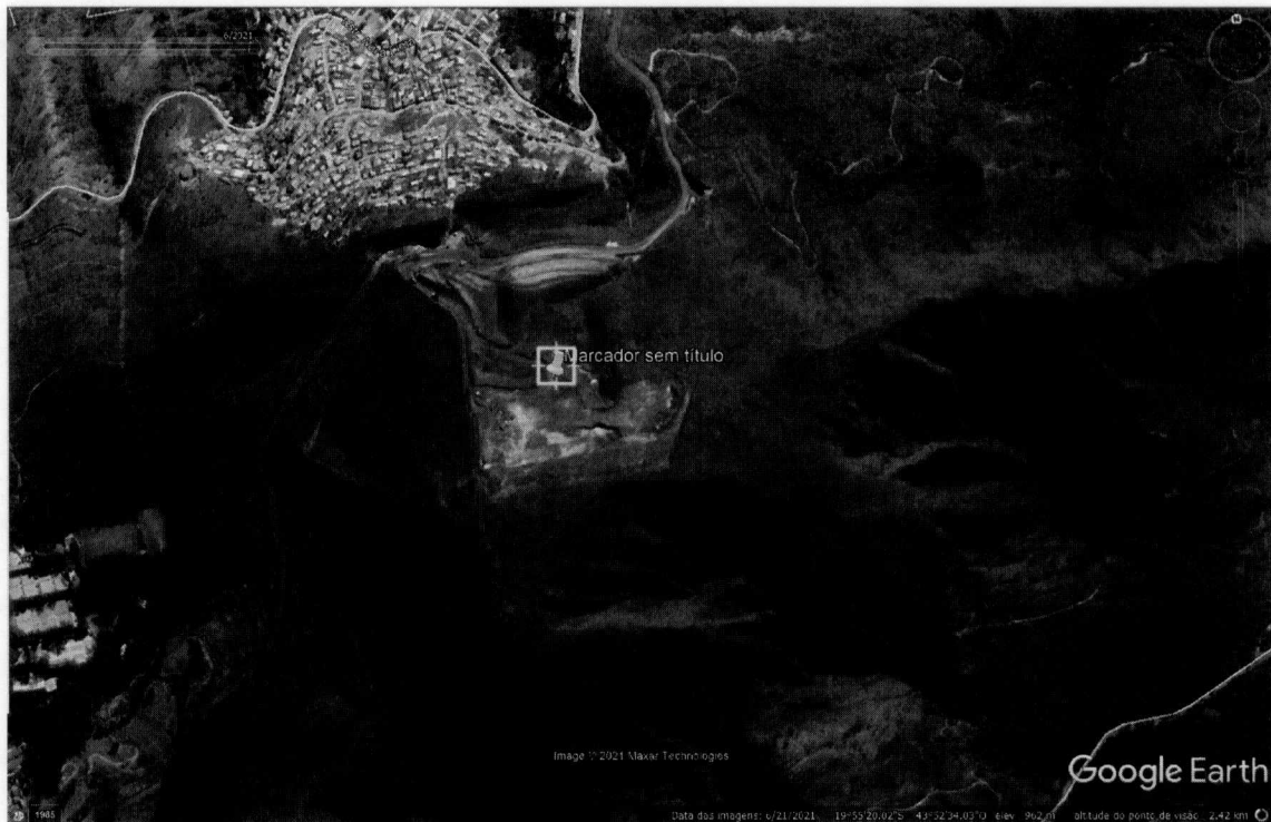
Figura 4 - Imagem de satélite do dia 06/06/2021

Adicionalmente, tendo em vista a quantidade de informações solicitadas e complexidade do assunto, gostaríamos de solicitar o agendamento de uma reunião para debatermos o presente pedido de informação, o qual é grande interesse da população de Belo Horizonte e demanda um acompanhamento bem próximo.