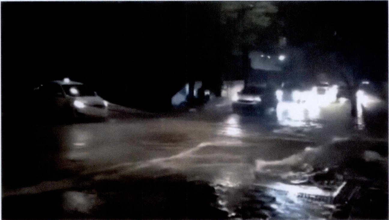
Foto 1: Cruzamento entre a Av. Prudente de Moraes e Rua Barão de Macaúbas.

Diário Oficial - Legislativa - 09-Nov-2021 - 10:21 - 003260-1/2