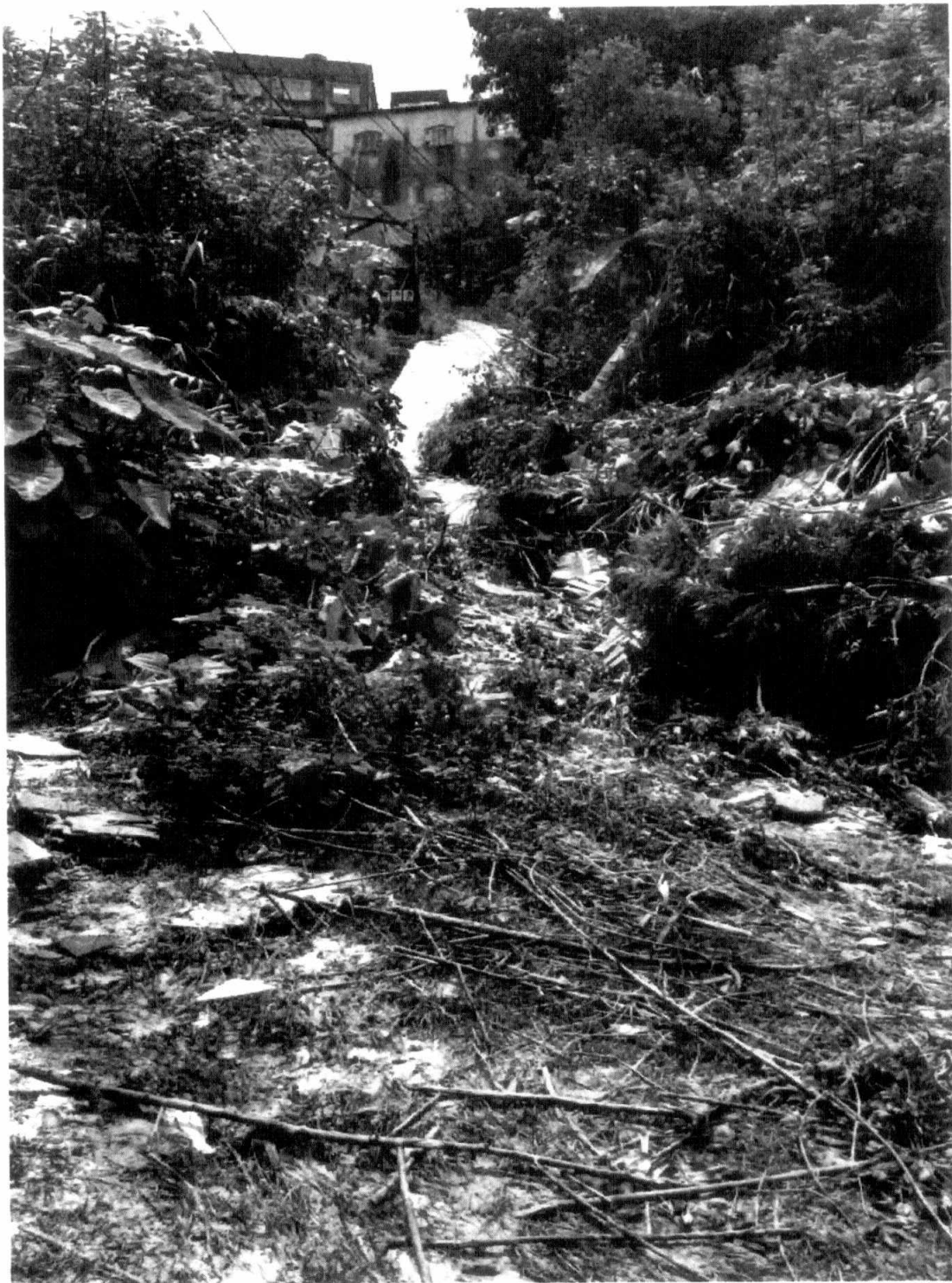
Rua Gaspar de lemos, no bairro Taquaril

Av. dos Andradas, 3. 100 - Gab. 319-B – Santa Efigênia – Belo Horizonte – MG – 30. 260 – 900 Tel.: (31) 3555 – 1167 – Email: ver.marcoscrispim@cmbh.mg.gov