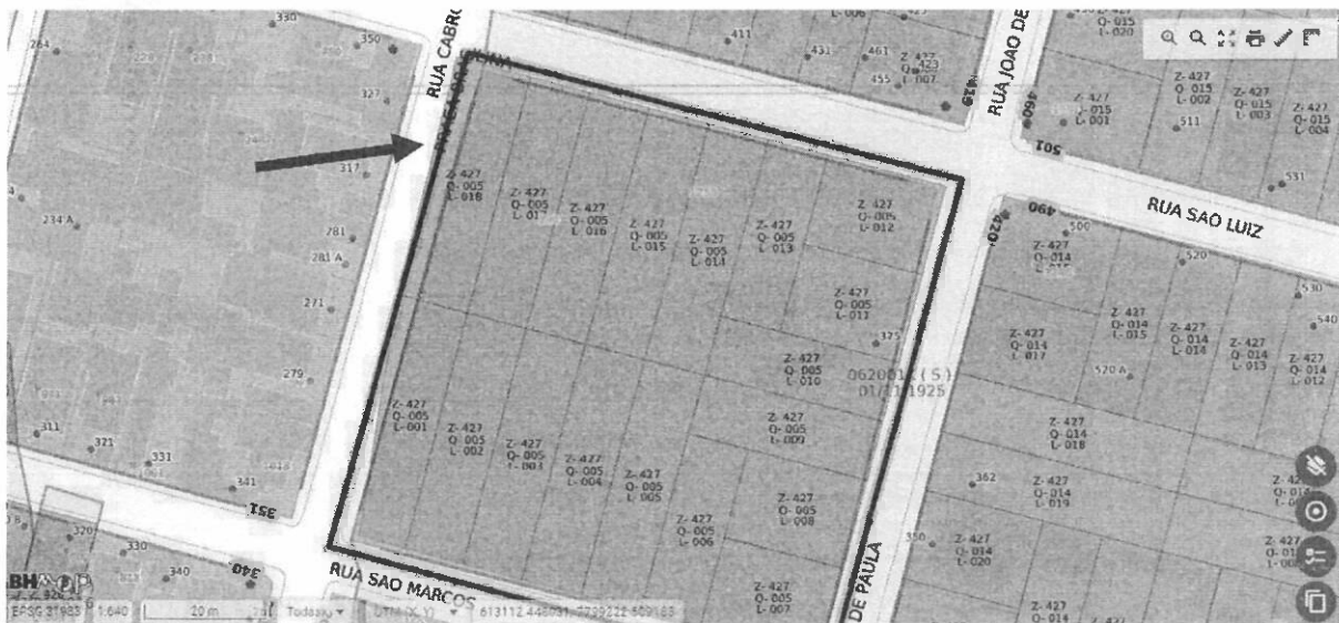
Praça Brasilina (código 311958)