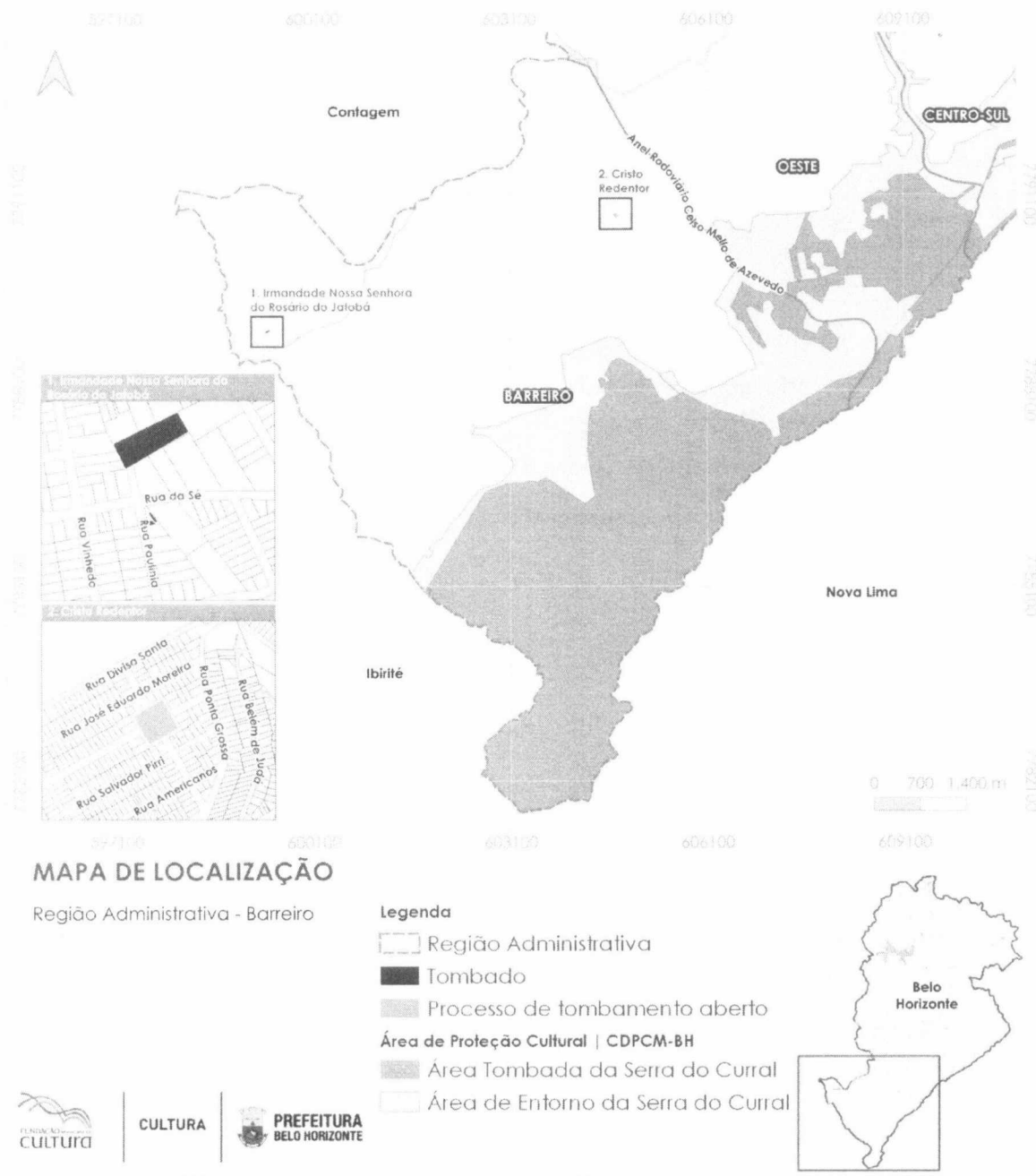
Figura 1 – Mapa de localização dos bens protegidos na Região Administrativa Barreiro.